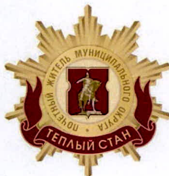
Рисунок нагрудного знака к званию «Почетный житель внутригородского муниципального образования – муниципального округа Теплый Стан в городе Москве»

к решению Совета депутатов внутригородского муниципального образования – муниципального округа Теплый Стан в городе Москве от 19.02.2025 № 104/3